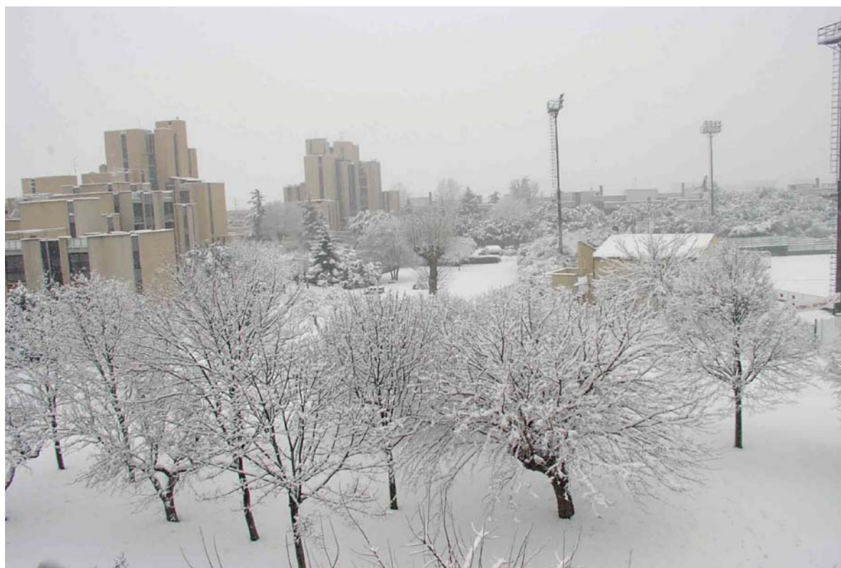
La neve ricopre ogni cosa con la sua bianca magia